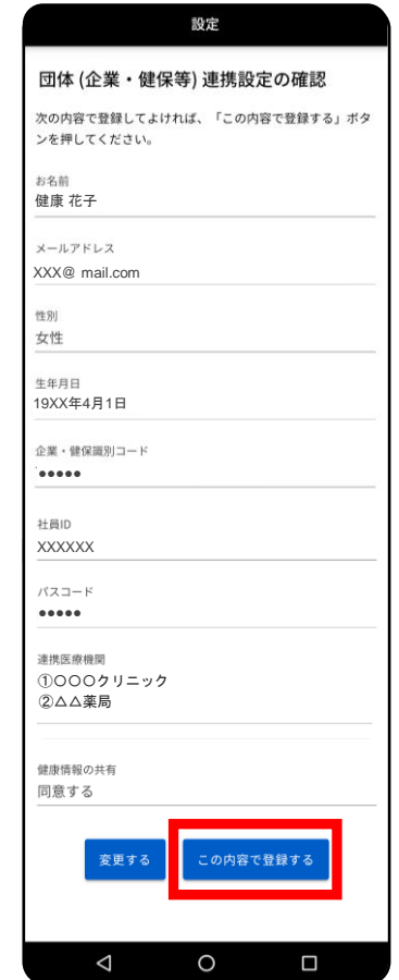
「この内容で登録する」

※「専用医療機関」は複数設定しても構いません。実際にオンライン診療予約やオンライン服薬指導予約をする際に、設定した中からお選びください。