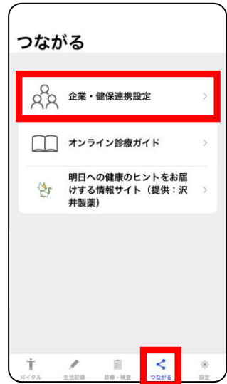
「つながる」> 「企業・健保連携設定」